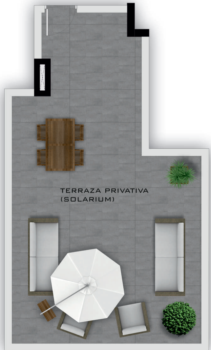
PLANTA PISO 4 VIVIENDA 02 (1/50)